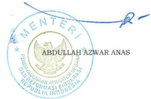
ABDULLAH AZWAR ANAS

MENTERI PENDAYAGUNAAN APARATUR NEGARA DAN REFORMASI BIROKRASI REPUBLIK INDONESIA,